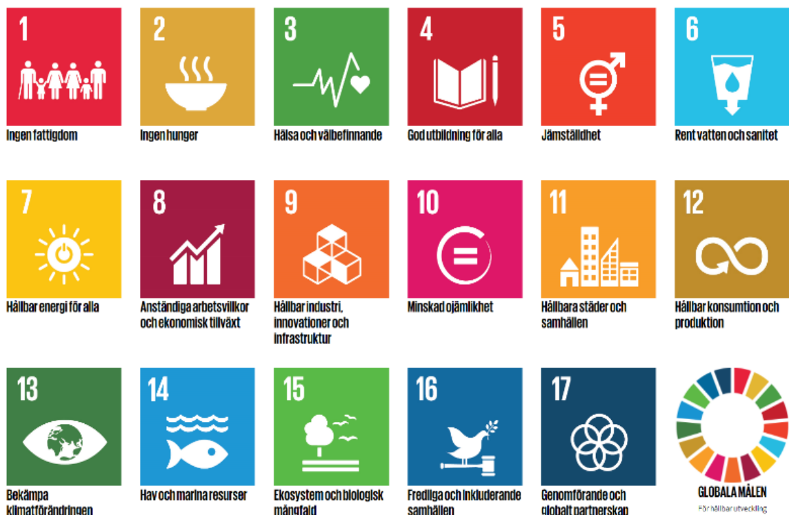
Figur 1. FN-länderna har åtagit sig att från och med 2016 och fram till år 2030 nå de 17 globala målen för att bekämpa klimatförändringar, skapa hållbara samhällen, försäkra mänskliga rättigheter för alla och leda världen mot en hållbar och rättvis framtid.

Att minska klimatpåverkan och hushålla med jordens resurser på ett rättvist och hållbart sätt räknas till vår tids stora utmaningar. Högskolan kan bidra direkt genom att ställa miljökrav, arbeta medvetet för att miljöanpassa verksamheten och indirekt genom forskningsframsteg, bildning och kritiska samtal kring just dessa frågor. Hållbar utveckling är också del av miljöledningsarbetet.