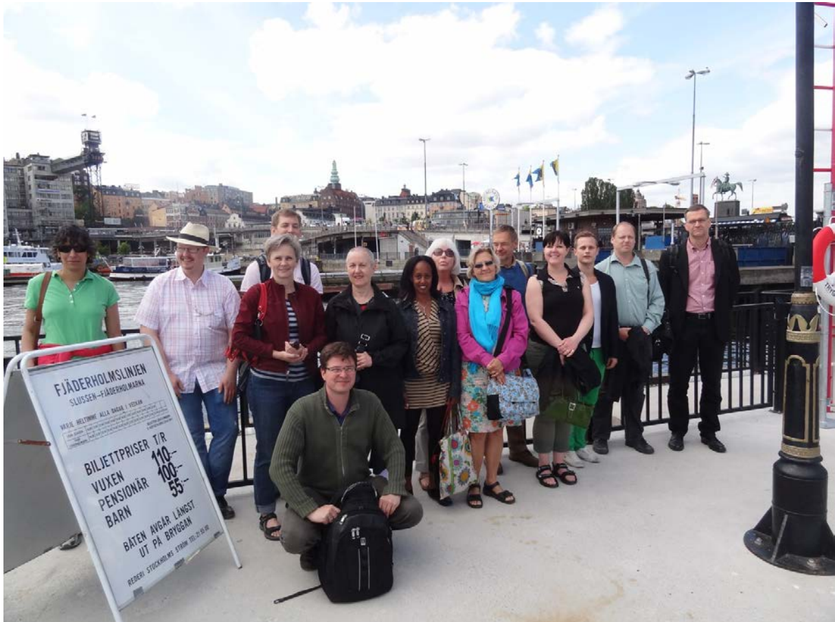
Samtidshistoriska institutets våravslutning med utfärd till Fjäderholmarna, 2012